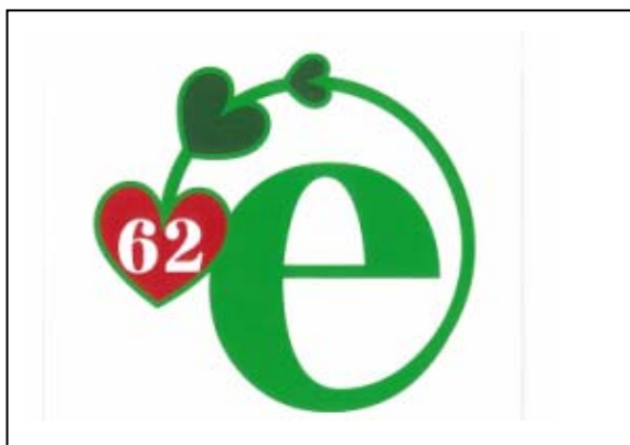
岡 瑞樹 18歳 専門学生 神奈川県相模原市