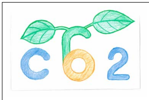
西 夏輝 10歳 東京都八王子市